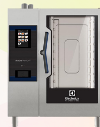
スチームコンベクション オープン