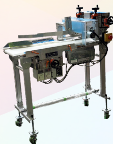
嵌合フードパック蓋閉め機